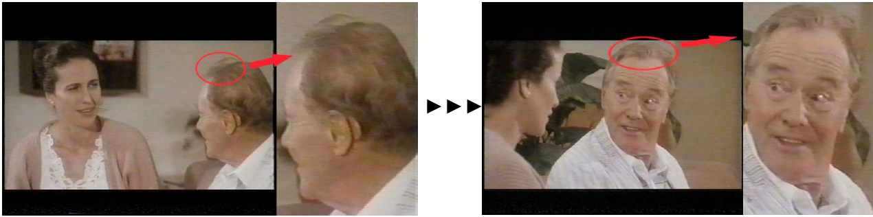
(figg. 5 e 6) il ciuffo di capelli spettinati di Jack Lemmon diventa una pettinatura omogenea nel controcampo

L'ultimo "mistake" che ho notato, quello più evidente, è la posizione di Zoe dopo che Ann le comunica, in un abbraccio consolatorio, che il figlio è morto. Zoe abbraccia la donna parzialmente, perchè cinge con il braccio sinistro il pallone da basket con cui stava giocando. Lo stacco successivo, che per noi spettatori rappresenta l'attimo immediatamente successivo, la coglie invece in una posa completamente diversa (figg. 7 e 8).