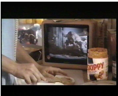
(fig 9) il fotogramma tratto dal film

Facendo una ricerca sul web, ho trovato che Skippy esiste ed è proprio ciò che si vede: una crema spalmabile (fig. 10). Quindi mi chiedo: perchè non è stata girata l'etichetta del barattolo sul set di ripresa, in modo da non mostrarne la marca, se proprio serviva raccontare questo gesto?!?