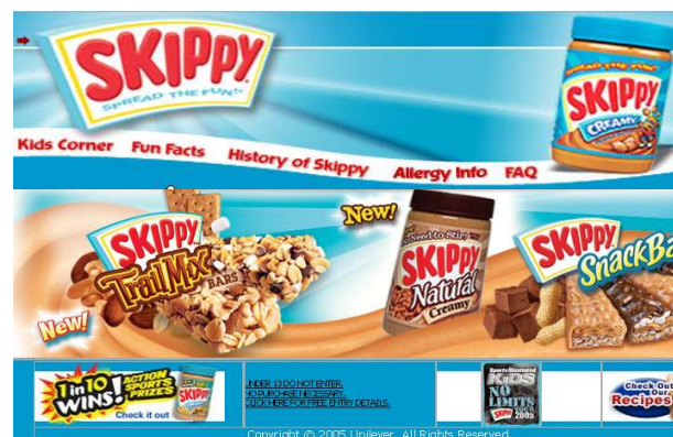
(fig 10)