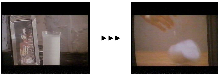
(figg. 1 e 2) esempio di montaggio metaforico di due inquadrature consecutive

Tutto il film è costruito da questo tipo di accostamenti, espedienti e analogie: ogni "incastro" è una prova di una straordinaria abilità registica.